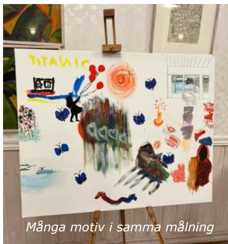
Många motiv i samma målning