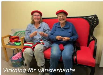
Virkning för vänsterhänta

Besökarna i alla åldrar var nyfikna på vad som erbjöds.