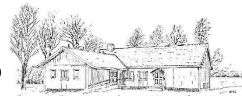
Bolmsö Bygdegård Sjöviken